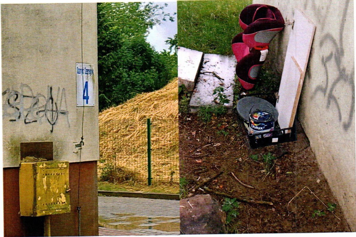
Ul. Bugaj 12 i 14, Dawidowicza 20 – pojemnik na odpady komunalne, a w nim m.in. odpady biodegradowalne.