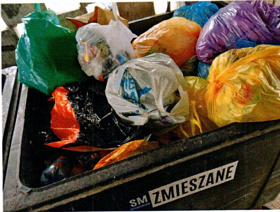
Ul. Piłsudskiego 7