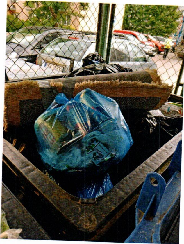
Ul. Bugaj 4, Bugaj 8 i Bugaj 10