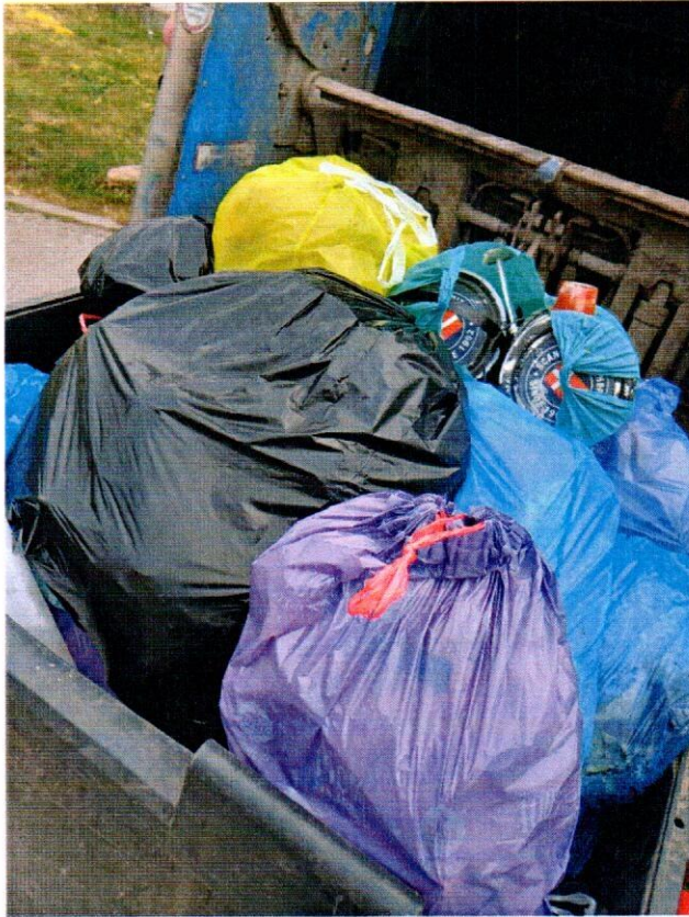
Ul. Powstańców 1863r 46/54