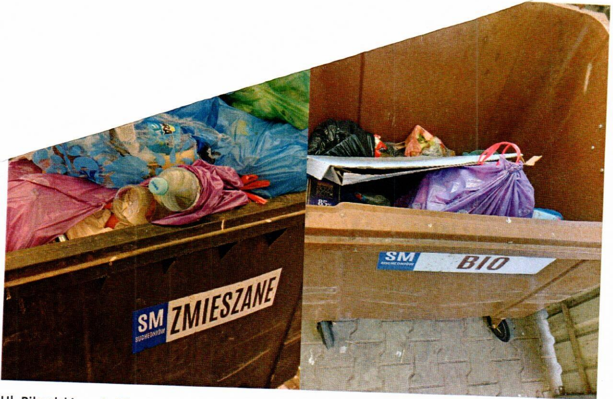
Ul. Piłsudskiego 2, Piłsudskiego 3, Piłsudskiego 4 i Piłsudskiego 5